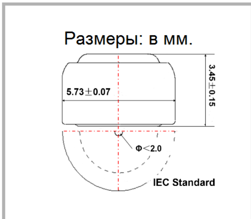
Рисунок 2. Конфигурация элемента питания.